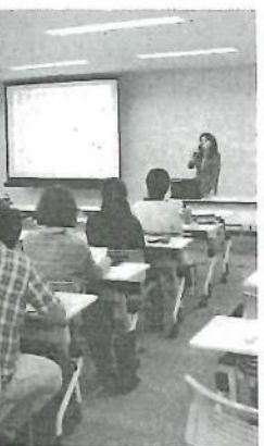
セミナーでは、創業保証の利