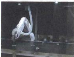
吸着タイプは銅と真鍮を高精度に選別