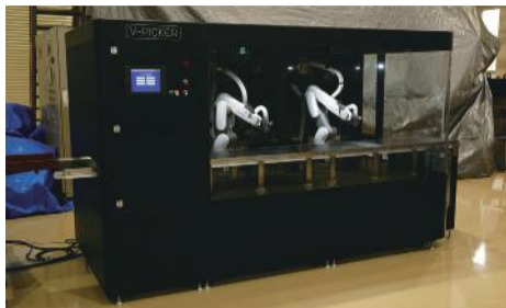
吸引タイプ(型式:KRB-V)は破碎後のミックスメタルから銅や真鍮を回収

レクターとV-BUSTERは現在まで着々と受注を積み重ねており、中国が雑品の輸入禁止を打ち出した19年末前後を起点に黒モーターを対象にしたスーパーシュレッダーと小型の複合物を対象にしたV-BUSTERを導入する動きが加速し、現在もサンプルテストの依頼や見積り案件が続いています。