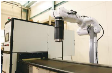
磁着タイプ(型式:KRB-M)はモーターコアなど銅線が絡んだ鉄素材をピックアップ

「Resoia」は産業廃棄物処理企業からの受注や引き合いが安定的に続いています。総合的に産業廃棄物を扱う企業を始め、特殊なリサイクルを手掛ける企業など、その受注実績は幅広いのが特徴であり、将来的な市場規模を見込んで、事業化へ向けた取り組みがすすまれています。